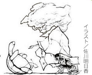
イラスト/佐川明日香

講座名(公開講座)、代表者氏名、住所、電話番号、参加者全員のお名前をお伝えください。